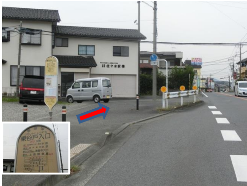
① 神奈川中央交通「東谷戸入口」下車、進行方向に100メートルほど進みます。