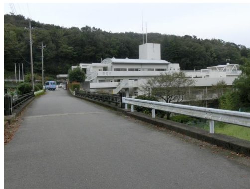
⑨ 「厚木精華園」に到着です。お疲れ様でした。