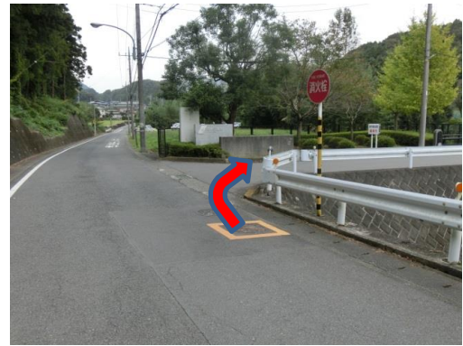
⑧ ⑦から250mほど進むと「厚木精華園の門標」があり、右折すると、到着です。