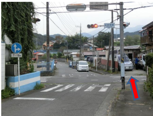
③ 「荻野尾崎」信号を直進します。