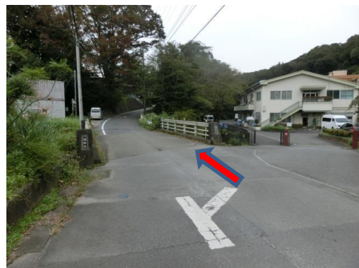
⑥ 紅梅学園が右手に見え、真弓川(深堀橋)を渡ります。