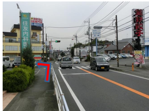
② 最初の信号機のある交差点を左折します(手前に「住友内科医院」あり)。