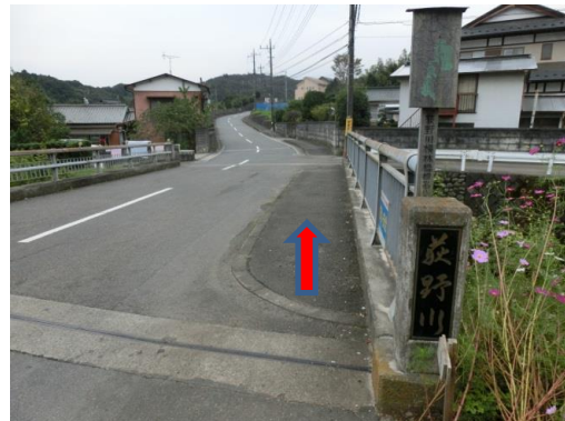
④ 「荻野川」を渡ります。そのまま道なりです。